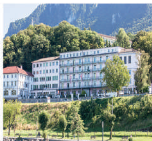
César Ritz Colleges Switzerland, Le Bouveret Campus