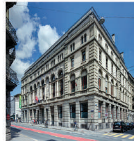
César Ritz Colleges Switzerland, Lucerne Campus