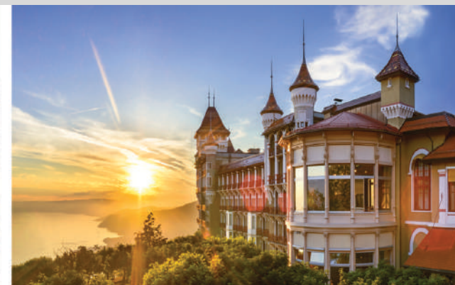
Swiss Hotel Management School, Caux Palace