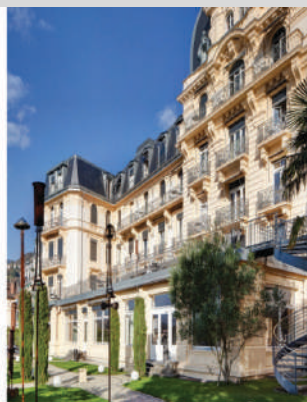
Hotel Institute Montreux