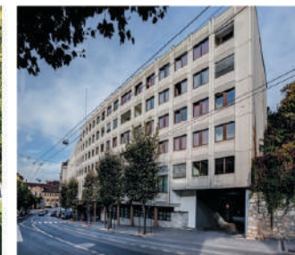
IHTTI School of Hotel Management