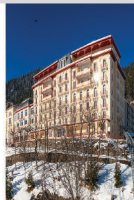
Swiss Hotel Management School, Leysin Campus