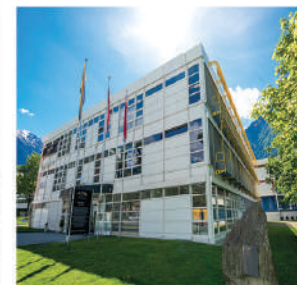
César Ritz Colleges Switzerland, Brig Campus